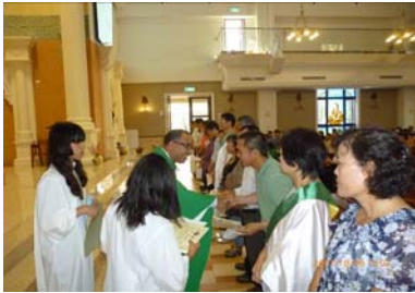
頒發聘書及派遣禮