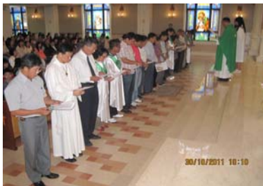
宣讀誓詞及全體合影