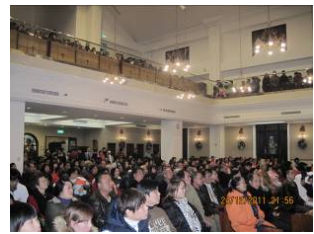
12月25日歡度聖誕聚餐共融暨主日學青年會原住民表演