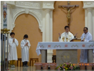
教友奉獻分享 — 復活蛋 —