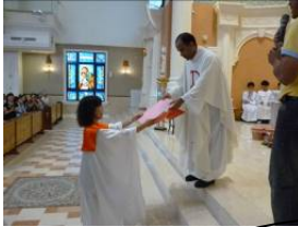
—教友獻上一大卡片及大紅包