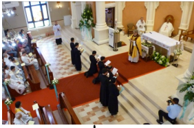
七位宣發誓願 之聖言會士