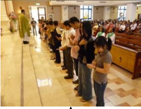
神父降福8月份壽星