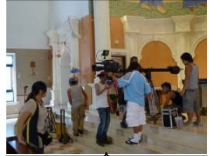
偶像劇來取景-看看誰比較帥