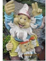
一家一菜歡慶耶穌復活節