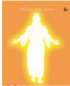
內湖天主堂 基督活力員來訪