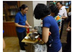
修女貼心準備點心