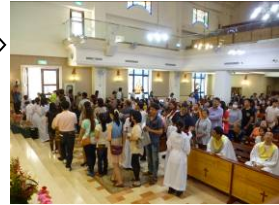
古阿水弟兄家庭祈禱