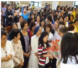
原住民義賣參加“愛的饗宴” -本堂所獲之聖像、十字架-