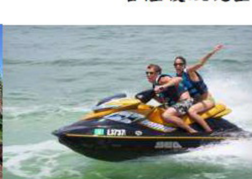
波德申海灘水上活動