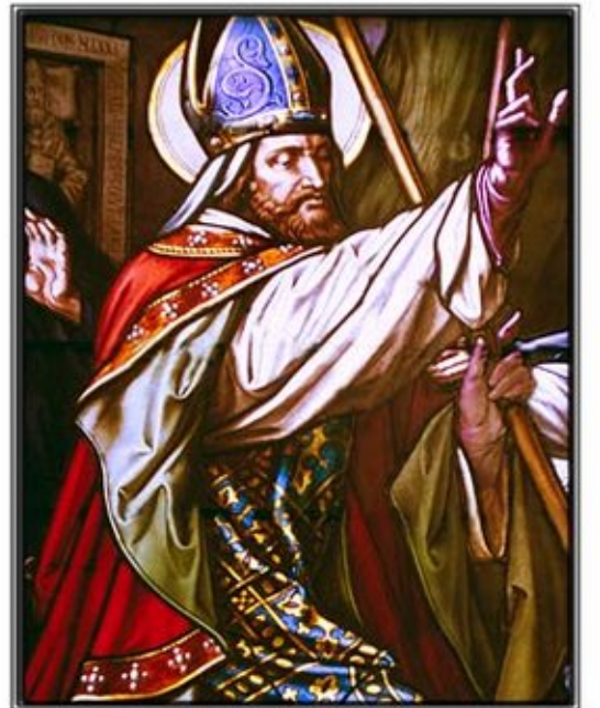
Detail from altar window - St. Stanislaus Church - Cleveland, OH

達尼老青年時，先後在格納森和巴黎的大學讀書。父母去世後，他將全部家產佈施給窮人棄俗修道晉升鐸品。克拉哥主教郎培聘他任講道員。由於達尼老口才出眾聖德卓越，講道獲得了輝煌的成就，使罪人改過行善，善人加倍熱心，郎培主教非常賞識他，自願辭職，讓達尼老做主教。可是達尼老不肯接受。直到朗培逝世教宗委派達尼老才繼任。公元一〇七二年，達尼老被祝聖為主教。